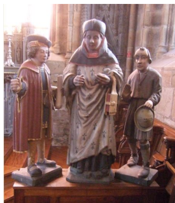
Triptyque avant restauration

Comme prévu par nos statuts et annoncé dans notre lettre d'information n°2, l'association a remis un chèque de 1500€ à la municipalité en soutien pour ces travaux.