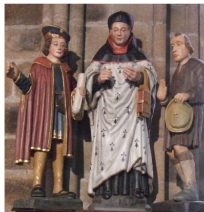
Triptyque après restauration