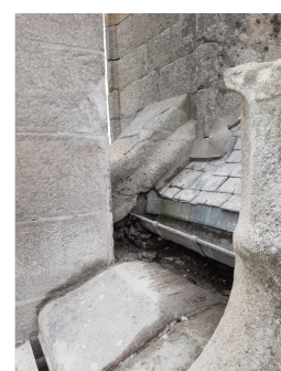
chéneau sud avant dépose

La deuxième tranche de travaux a donc débuté comme prévu depuis quelques jours et se poursuivra sur un calendrier de 10 mois.