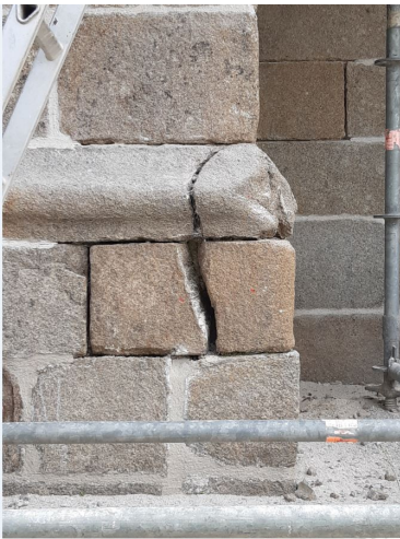
Pierre de soutien massif nord