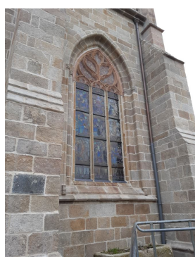
Pose grille vitrail