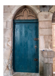
Mise en teinte d'origine

De nombreuses greffes de pierres ont redonné toute leur beauté aux rosaces des vitraux. Les vitraux eux-mêmes ont été repris. Nettoyés, consolidés par la reprise de barbotières ils sont à nouveau protégés par de nouvelles grilles.