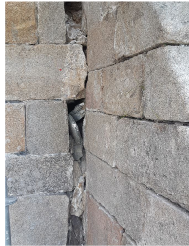
Désolidarisation dernière travée

L'interrogation principale se situait au niveau du traitement de l'écoulement des eaux pluviales à partir du toit. Après mûre réflexion des différents corps de métiers concernés, du cabinet d'architecte ARCHAEB, maître d'œuvre, de l'Ingénierie de la Drac, aide à maîtrise d'ouvrage pour la municipalité, un élargissement des chéneaux a été décidé. Pour se faire, la balustrade supérieure a été déposée, rehaussée d'une talonnette en granit de 14,5 cm. Cela a permis de faire un coffrage de réception des eaux plus large et donc plus efficace. Deux gouttières supplémentaires ont été rajoutées pour une meilleure évacuation. Le fil d'eau a été créé. Le bon écoulement des pluies récentes confirme l'efficacité de cet aménagement. Il sera à adapter et mettre en oeuvre sur la façade sud.