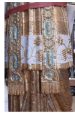
Des détails époustouffants pour cette statue en terre cuite