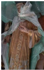
St Yves à son départ de Minihy

Pour vous donner un avant-goût de la beauté du travail effectué, quelques photos des statues et des bannières aux ateliers de restauration :