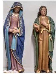
Vierge et saint Jean ensemble de crucifixion