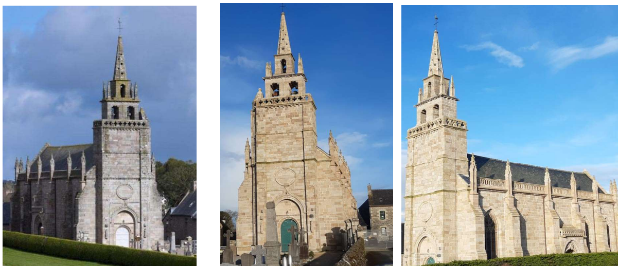
L'église avant travaux extérieurs et après

L'édifice a déjà retrouvé belle allure extérieurement et nous pouvons admirer la réussite de tous les travaux engagés.