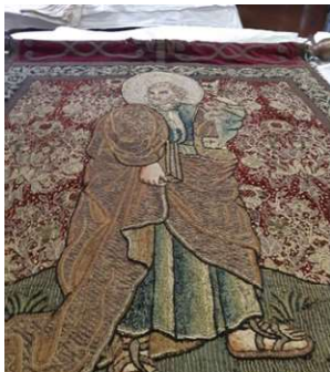
Grande bannière de Saint Pierre